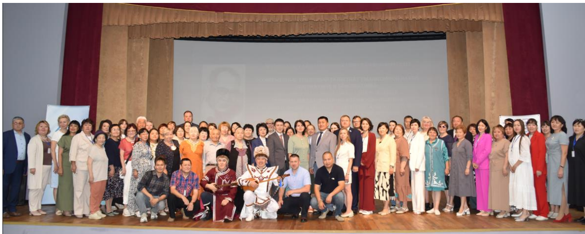
Рис. 3. Участники конференции. Горно-Алтайск, 3.07.2025 г. Fig. 3. Conference participants. Gorno-Altaysk, July 3, 2025.