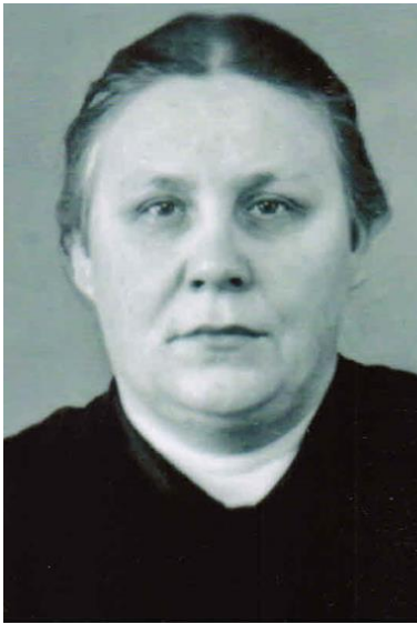
Рис. 2. Е. П. Лебедева Fig. 2. E. P. Lebedeva

На момент начала своей деятельности в Сибирском отделении АН СССР В. А. Аврорин являлся признанным специалистом по тунгусо-маньчжурским языкам. К тому времени уже вышла его двухтомная «Грамматика нанайского языка», которая давала подробное, системное описание нанайского на нескольких языковых уровнях, было положено начало сравнительному анализу тунгусо-маньчжурских языков. 1960-е гг. стали временем, когда Валентин Александрович приступил к изучению и описанию ороцкого языка, сведений о котором на тот момент было собрано крайне мало. У него имелся также опыт тесного взаимодействия с языковыми сообществами коренных малочисленных народов, рефлексии над условиями существования национальных языков, над языковой политикой, которая учитывала бы потребности этноса. Все это в совокупности делало В. А. Аврорина незаурядным педагогом, способным передать ученикам не только огромный багаж знаний, но и глубоко осмысленный подход к работе с языками, понимание значимости сибиреведческих инициатив в исторической перспективе.