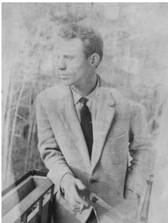
Рис. 6. Б. В. Болдырев Fig. 6. B. V. Boldyrev

Болдырев , выпускник эвенкийской группы из первого набора гуманитарного факультета НГУ. За несколько десятилетий непрерывной работы в Институте он сумел не только оставить колоссальный объем новых научных данных как по эвенкийскому языку, так и по тунгусо-маньчжуроведению в целом (в общей сложности его библиография насчитывает более ста публикаций), но также расширить и развить группу специалистов, которую возглавил в 1990-е гг., сохраняя высокий уровень научного анализа, заданный его учителем.