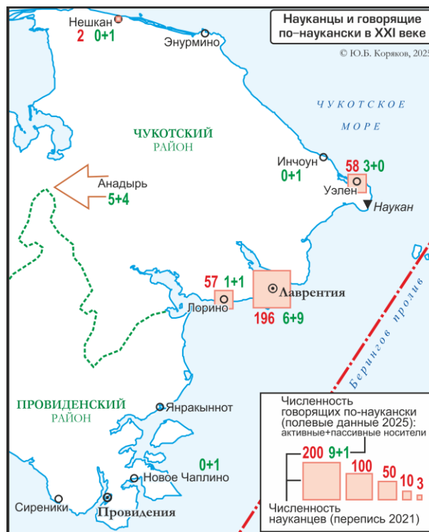
Карта 1. Распределение науканцев и говорящих по-наукански по поселкам Чукотского района Чукотского автономного округа по полевым данным на 2025 г. Map 1. Distribution of the Naukan community (by ethnic identification) and speakers of Naukan Yupik in the villages of Chukchi region based on field data as of 2025.

* Включает всех эскимосов, не только из науканского сообщества.